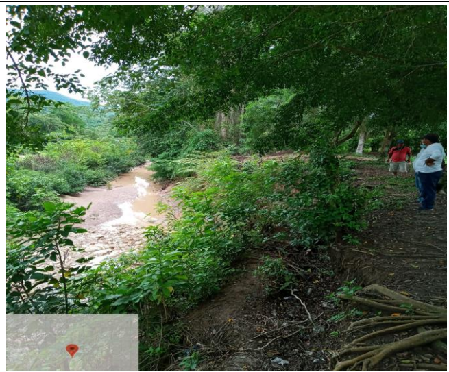
ESTADO EROSIONADO DE LA RIBERA SUPERIOR DE LA MARGEN DERECHA DE LA QUEBRADA MISHQUIYACU